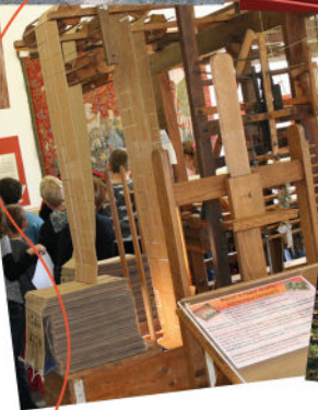
la Maison du Textile