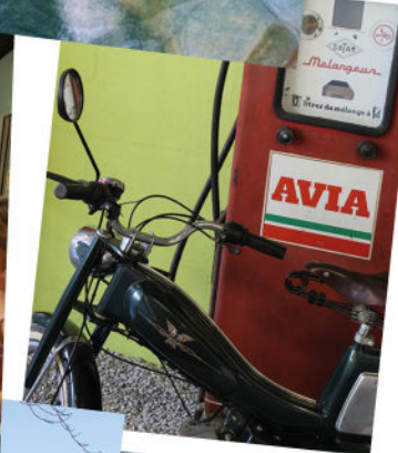
le Musée du Vermandois

Our museums vividly showcase the diverse aspects of our history connected to textiles, waterways, ancient trades, antiquity, and... the vintage blue moped.