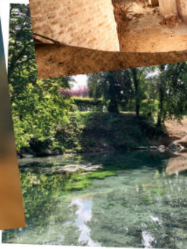
les Sources de l'Escaut