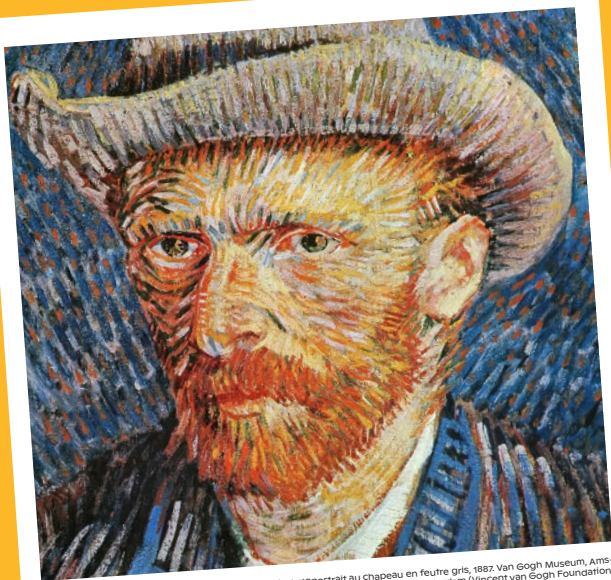
© Vincent van Gogh, Autoportrait au chapeau en feutre gris, 1887. Van Gogh Museum, Amsterdam (Vincent van Gogh Foundation)

Une « balise » incontournable du parcours de Van Gogh en Europe qui se poursuit avec d'autres lieux à visiter dans le Borinage comme par exemple la maison Van Gogh et le site de Marcasse à Colfontaine.